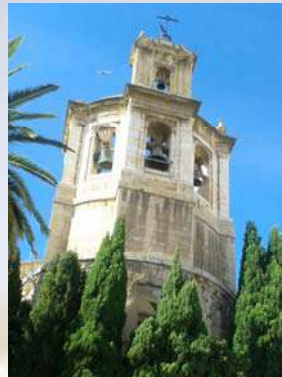
Iglesia San Andrés (Jaén)