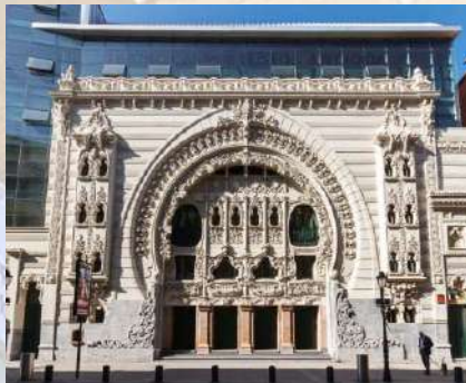
Teatro Campos Eliseos (Bilbao)