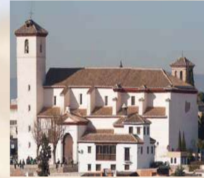
Iglesia San Nicolás (Granada)