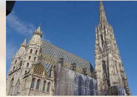
Catedral de San Esteban - Viena (Austria)