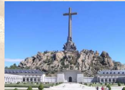
Valle de Los Caídos - San Lorenzo del Escorial (Madrid)