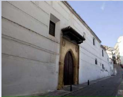
Convento de Sta Clara de Loja (Granada)