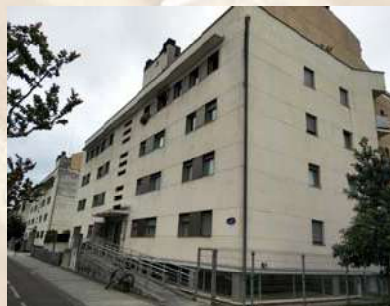
Complejo residencial (San Sebastián)