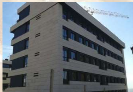
Urbanización Montecerrado (Oviedo)