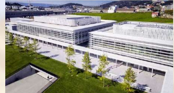
Nuevas oficinas sede central INDITEX – Arteixo (A Coruña)