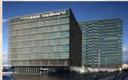
Hotel Boulevard Vitoria (Vitoria-Gasteiz)