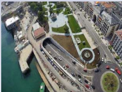
Túnel Centro Botín – Banco Santander (Santander)