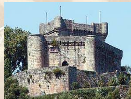
Castillo de Sobroso - Vilasobroso (Pontevedra)