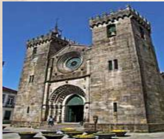
Catedral de Viana Do Castelo (Portugal)