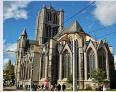
Catedral de San Bavon - Gante (Bélgica)