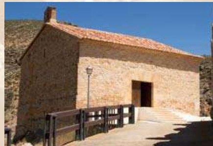
Ermita de Virgen del Castillo - Monterde (Zaragoza)