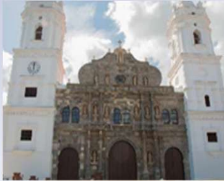
Catedral de Ciudad de Panamá (Panamá)