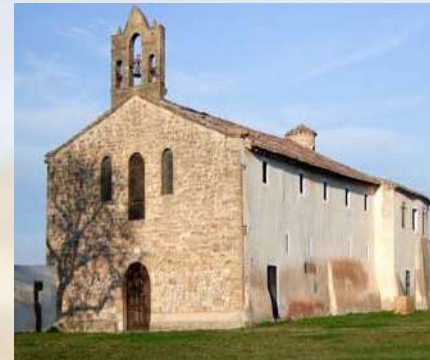
Ermita de Tricio (La Rioja)