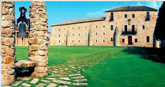
Bodegas Barón de Ley - Mendavia (Navarra)