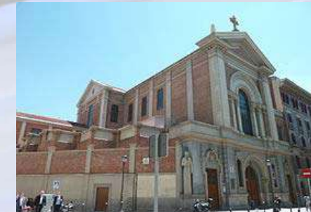
Basílica de Jesús de Medinaceli (Madrid)