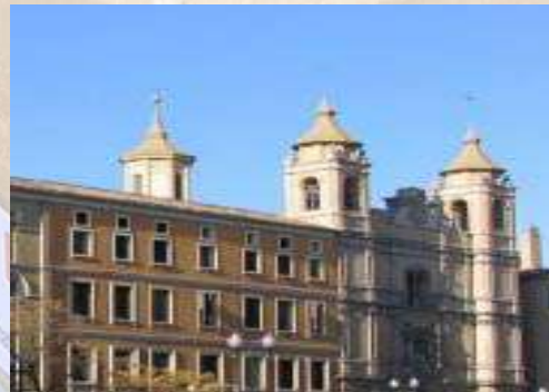
Colegio Escolapios (Zaragoza)