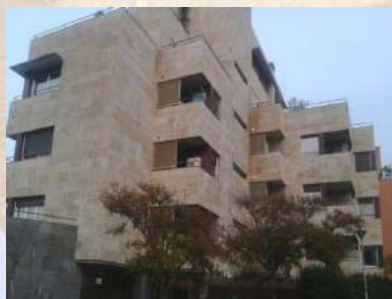
Complejo Residencial - Tudela (Navarra)