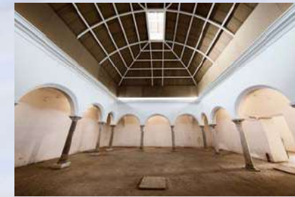
Baños Árabes Reina Mora (Sevilla)