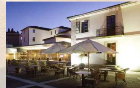
Hotel AC Palacio del Carmen (Santiago de Compostela)