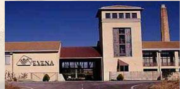
EVENA - Olite (Navarra)