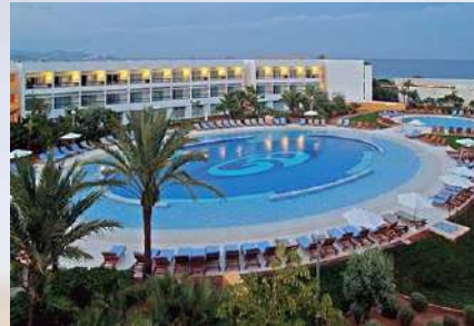
Hotel Grand Palladium White Island Resort & Spa (Ibiza)