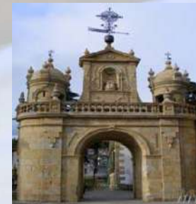
Puerta de Sta Ana - Durango (Vizcaya)