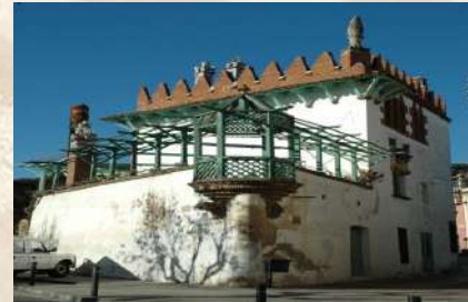
Casa Puig i Cadafach - Argentona (Barcelona)