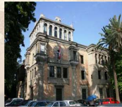
Pabellón de Perú - Expo 1929 (Sevilla)