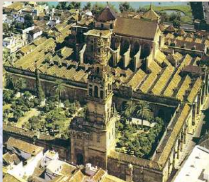
Mezquita Catedral (Córdoba)