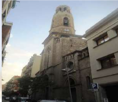
Iglesia de Santa Madrona (Barcelona)