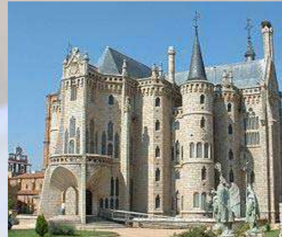
Palacio Episcopal Astorga (León)