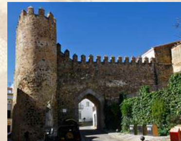
Muralla Jerez de los Caballeros (Badajoz)