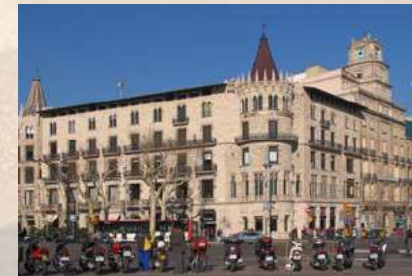
Casa Pascual i Pons (Barcelona)