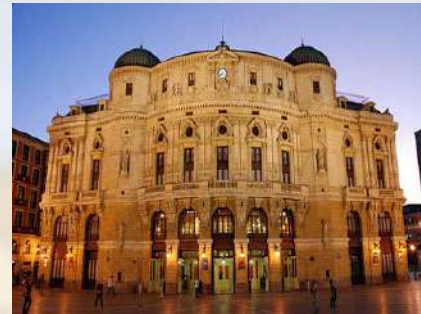
Teatro Arriaga (Bilbao)