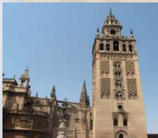
La Giralda (Sevilla)