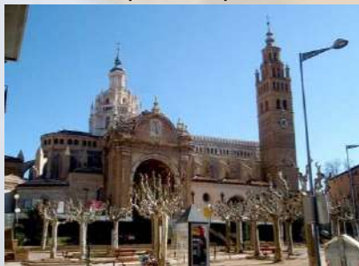
Catedral de Tarazona (Zaragoza)