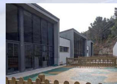
Escuela Infantil - Estella (Navarra)