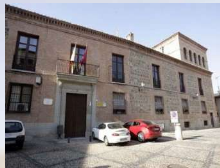
Palacio del Marqués de Malpica (Toledo)