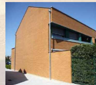
Viviendas Unifamiliares (Pamplona)