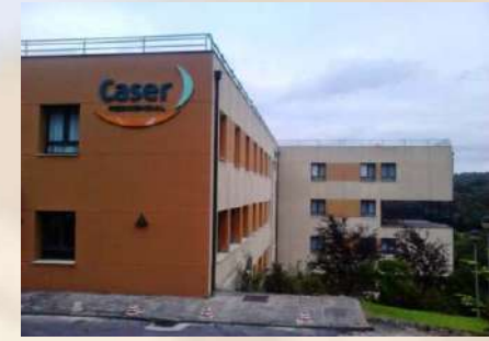
Residencia CASER (Bilbao)