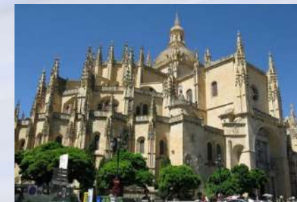
Catedral de Segovia (Segovia)