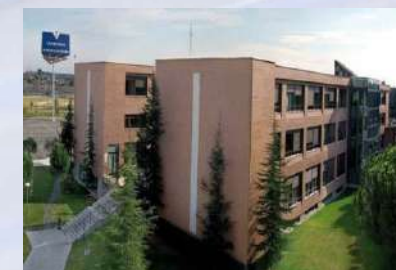
Universidad Francisco de Vitoria (Madrid)