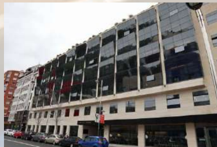
Hotel Domene (Bilbao)