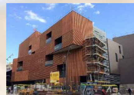
Escola Massana (Barcelona)