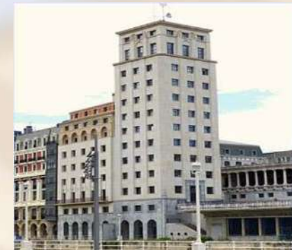
Torre Bailén ADIF (Bilbao)