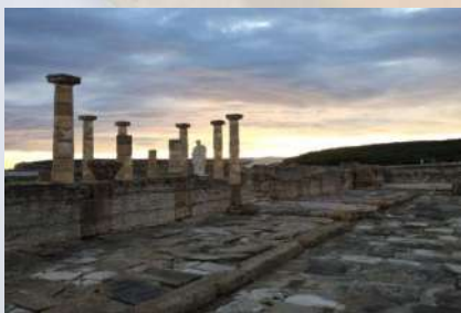
Yacimiento Arqueológico Baelo Claudia (Cádiz)