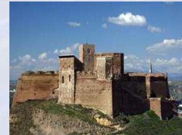
Castillo de Monzón (Huesca)