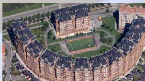
Edificios Davila Park (Santander)