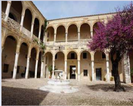
Castillo Palacio de los Ribera - Bornos (Cádiz)