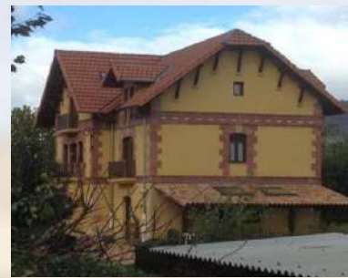
Antigua Estación Vasco-Navarro (Álava)