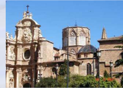
Museo de la Catedral de Valencia (Valencia)