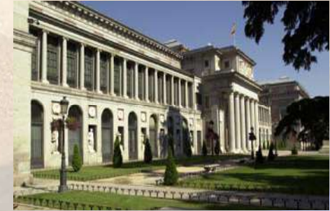
Museo del Prado (Madrid)