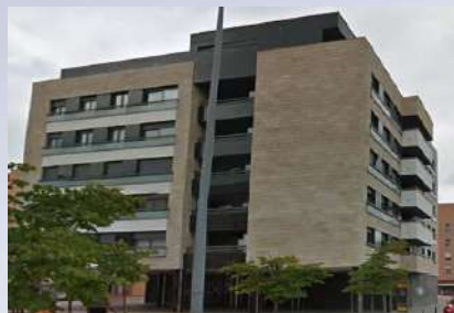
Complejo Residencial – Huarte (Navarra)