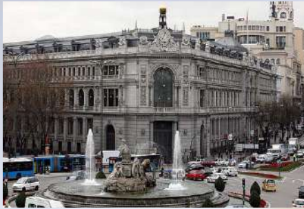
Sede Central Banco de España (Madrid)