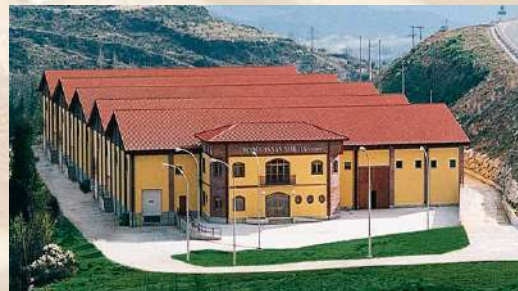
Bodegas San Martín - S. Martín de Unx (Navarra)