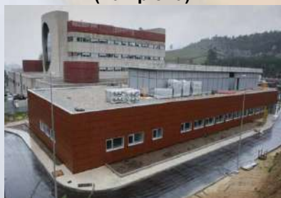
Hospital do Salnes – Villagarcía de Arousa (Pontevedra)