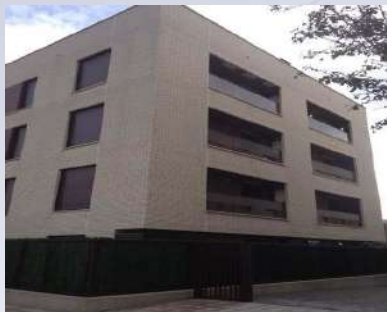
Complejo residencial (Pamplona)