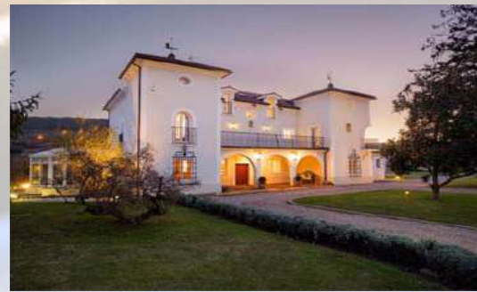
Bodega Marqués de Vargas - Logroño (La Rioja)