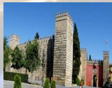
Reales Alcázares de Sevilla (Sevilla)