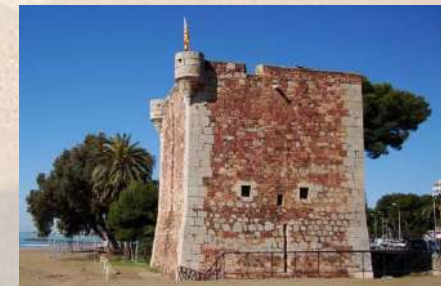
Torre San Vicente - Benicassim (Castellón)