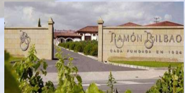
Bodegas Ramón Bilbao - Haro (La Rioja)