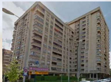
Complejo Residencial (Pamplona)