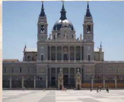
Catedral de La Almudena (Madrid)