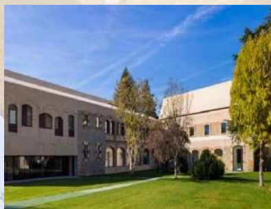
Centro Psicogeriatrico (Pamplona)