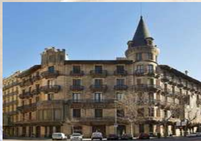
Casa Burés (Barcelona)