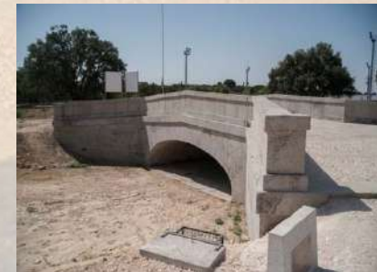
Puente Ventura Rodriguez - Boadilla del Monte (Madrid)