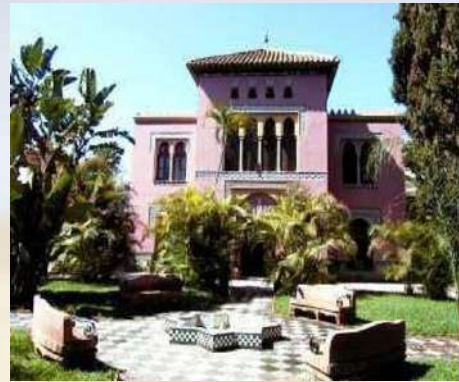
Palacete de Nájera - Almuñécar (Granada)