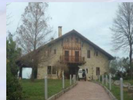
Caserío Orio (Guipúzcoa)