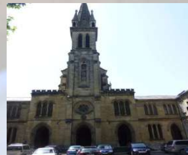
Convento de Salesas - Vitoria (Álava)