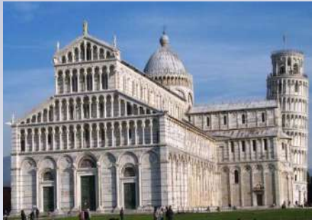
Catedral de Pisa (Italia)