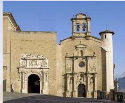
Museo de Navarra (Pamplona)