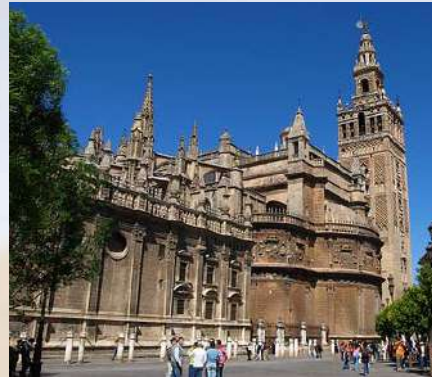
Catedral de Sevilla (Sevilla)