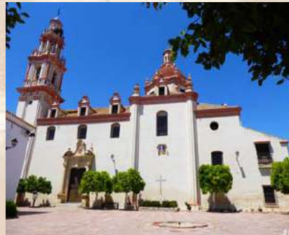
Iglesia San Pedro Apóstol - Peñaflores (Sevilla)