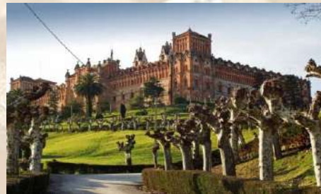
Universidad Pontifica de Comillas (Cantabria)