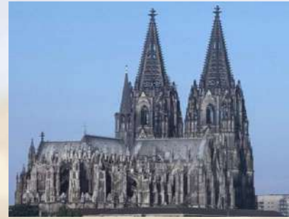
Catedral de Colonia (Alemania)