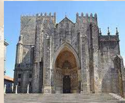
Catedral de Tui (Pontevedra)