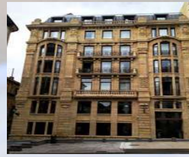
Hotel Plaza Lasala (San Sebastián)