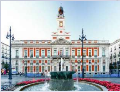
Puerta del Sol (Madrid)