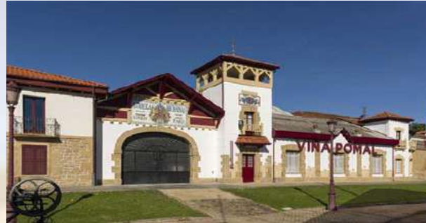
Bodegas Bilbainas - Haro (La Rioja)