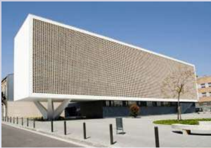
Centro de Atención Primaria - Badalona (Barcelona)