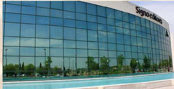
Edificio oficinas Signo Editores (Madrid)