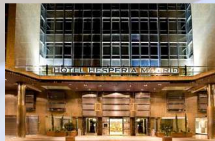
Hotel Hesperia (Madrid)