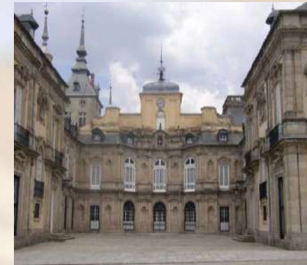
Palacio Real de la Granja San Ildefonso (Segovia)