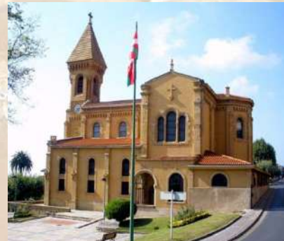
Iglesia de San Ignacio – Getxo (Vizcaya)