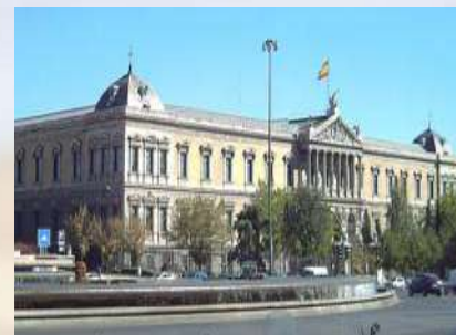
Biblioteca Nacional (Madrid)