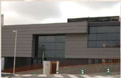
Edificio GBB (Guipúzcoa)