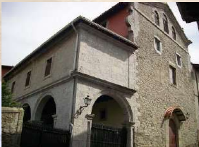
Convento Madres Dominicas - Lekeitio (Vizcaya)