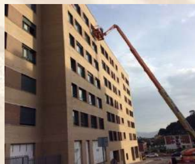
Complejo residencial (Santander)