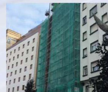
Complejo residencial (Santander)