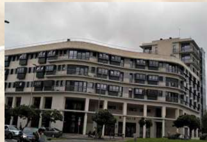
Complejo residencial (San Sebastián)