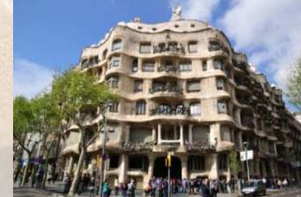
Casa Milá – La Pedrera (Barcelona)