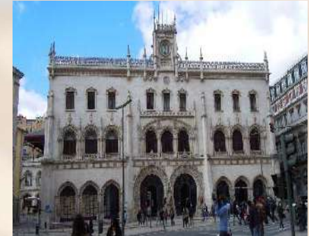
Estación de Rossio (Lisboa, Portugal)