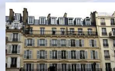
Complejo residencial – París (Francia)