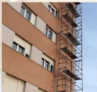
Complejo residencial (Santander)