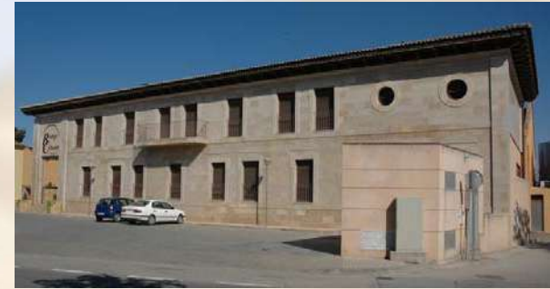
Bodega Coop. Carbonera - Cintruenigo (Navarra)