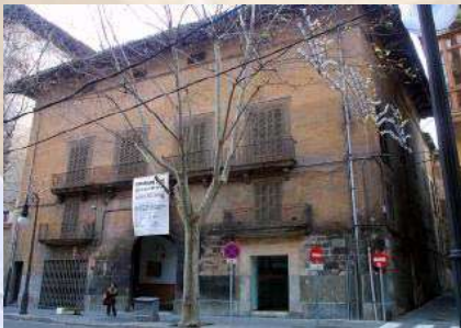
Casal Balaguer (Palma de Mallorca)