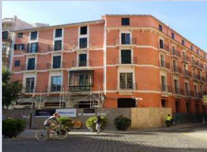
Edificio Plaza Cort (Palma de Mallorca)