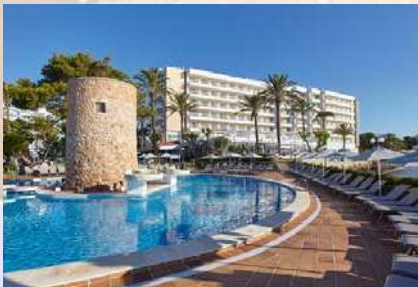
Hotel Torre del Mar (Ibiza)