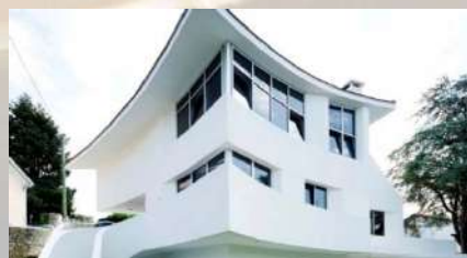
Viviendas de lujo - Hendaia (Francia)