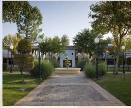
Parador de Albacete (Albacete)