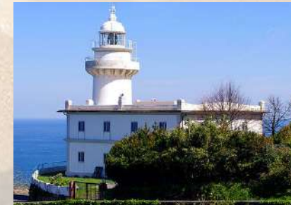
Faro del Monte Igeldo (Guipúzcoa)