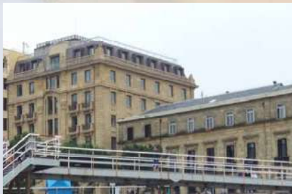
Hotel Plaza Lasala (San Sebastián - Donostia)