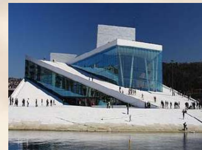
Opera House - Oslo (Noruega)