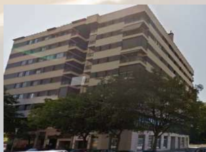
Complejo residencial (Pamplona)