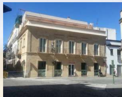
Complejo Residencial – Jerez de la Frontera (Cádiz)