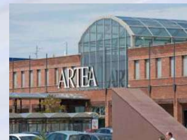
Centro Comercial ARTEA (Vizcaya)