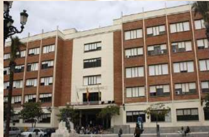
Universidad de Cadiz - Puerto Real (Cádiz)