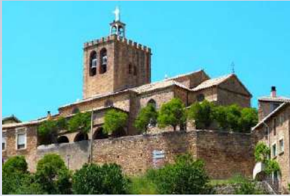
Iglesia de Santa Mª Asunción – Liedena (Navarra)