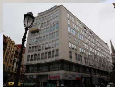
Complejo residencial (Bilbao)