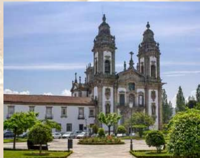
Monasterio de S. Miguel de Refojos (Cabeceiras de Basto - Portugal)