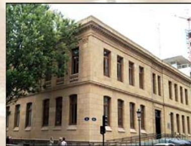
Escuelas Amara Berri (San Sebastián)