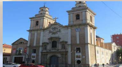
Iglesia del Carmen (Murcia)