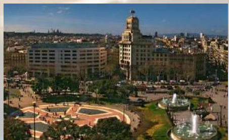
Edificio Pans - Plaza Urquinaona (Barcelona)