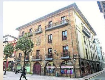
Palacio de Quirós (Oviedo)