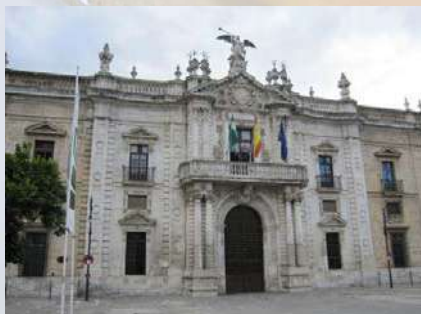
Rectorado - Antigua Fábrica Tabacos (Sevilla)