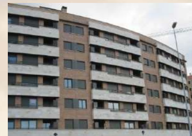
Complejo residencial (San Sebastián)