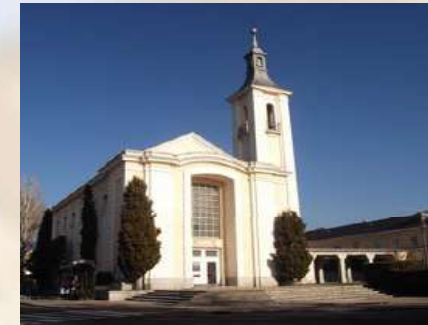
Iglesia Virgen del Carmen de El Pardo (Madrid)