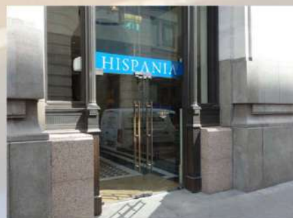
Restaurante HISPANIA (Londres - UK)