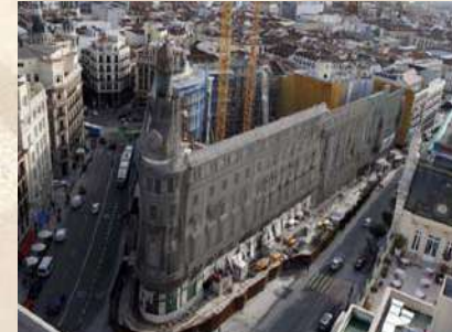
Complejo Canalejas (Madrid)