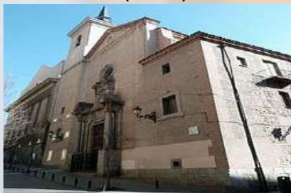
Iglesia de Ntra. Sra. Del Carmen (Madrid)