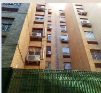
Complejo residencial (Sevilla)