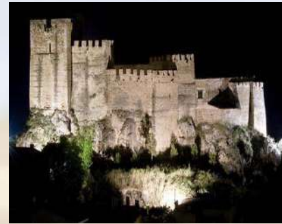
Castillo de Yeste (Albacete)