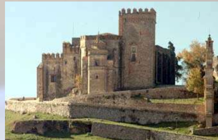
Castillo de Aracena (Huelva)