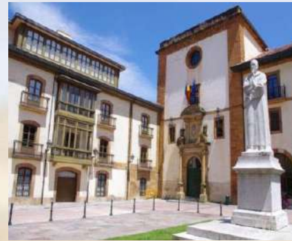
Antigua Facultad de Psicología (Oviedo)