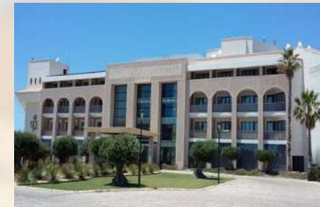
Hotel AR Golf Almerimar (Almeria)