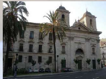
Palau del Temple (Valencia)