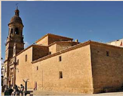
Iglesia de San Salvador - Arroniz (Navarra)