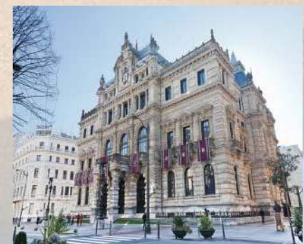
Palacio de la Diputación (Bilbao)