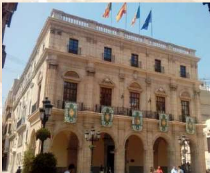
Ayuntamiento de Castellón (Castellón)