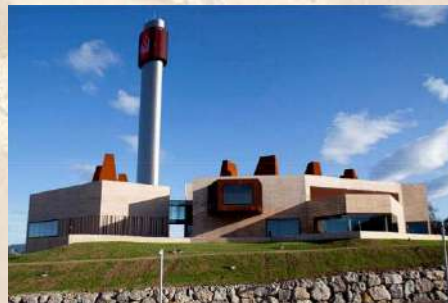
Edificio CPD – Banco Santander (Santander)