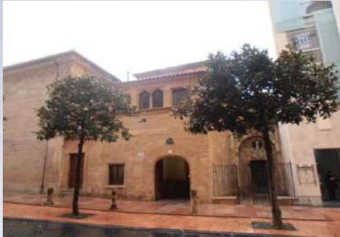
Edificio Rectorado Universidad de Oviedo (Oviedo)