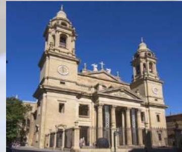
Catedral de Pamplona (Navarra)