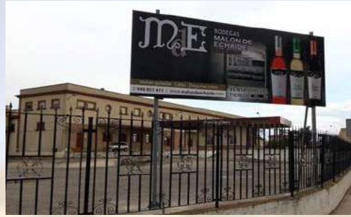
Bodegas Malon de Echaide - Cascante (Navarra)