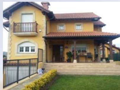
Chalet unifamiliar (Santander)