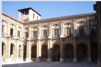
Claustro Basílica San Isidoro (León)