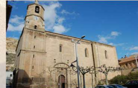
Iglesia San Miguel de Lodosa (Navarra)