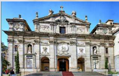
Iglesia de Santa Bárbara (Madrid)