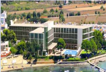
Hotel ME Meliá Ibiza (Ibiza)