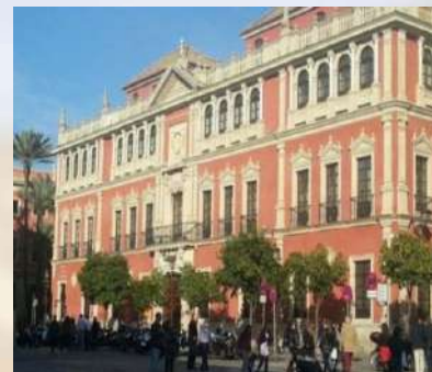
Sede Fundación Cajazol / Caixabank (Sevilla)