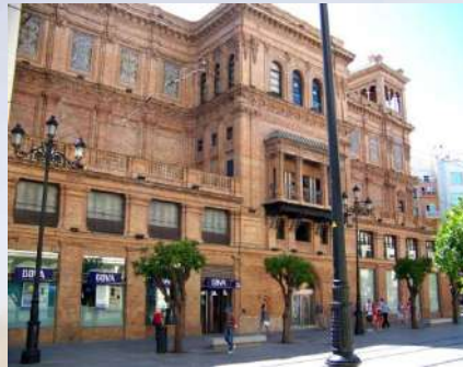
Edificio Coliseo (Sevilla)