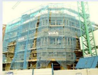
Edificio Mª Díez de Haro (Haro, La Rioja)