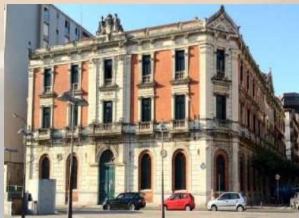
Edificio Antigua Aduana (Bilbao)