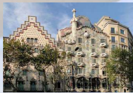
Casa Batlló (Barcelona)