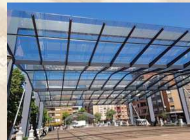
Plaza San Pedro - Sestao (Vizcaya)