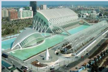
Ciudad de las Artes y las Ciencias (Valencia)