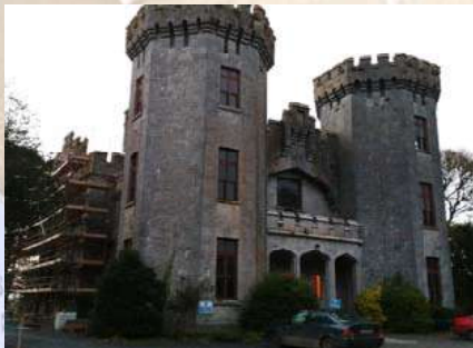
Castillo en condado de Tipperary (Irlanda)