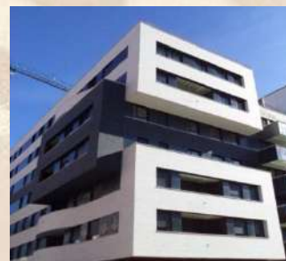
Complejo residencial (Logroño)