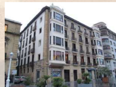
Complejo residencial (San Sebastián)