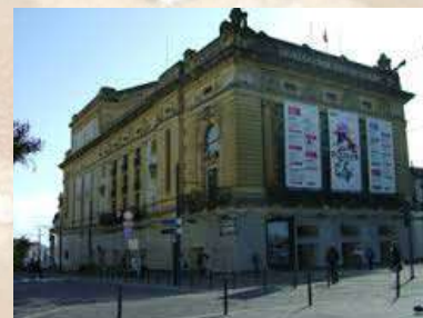
Teatro Nacional San Joao (Oporto-Portugal)