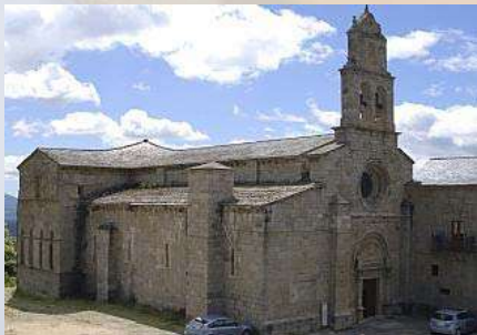
Monasterio de San Martín de Castañeda (Zamora)