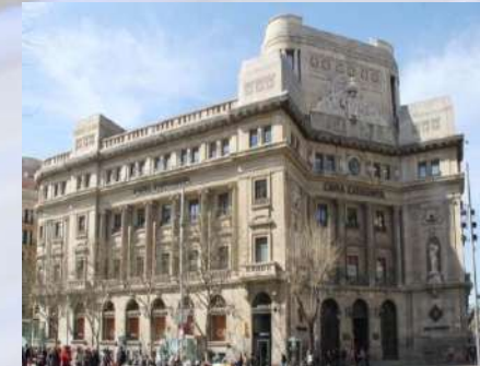
Edificio Sede CatalunyaCaixa (Barcelona)