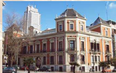
Museo Cerralbo (Madrid)