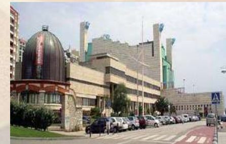
E.T.S. Náutica (Santander)