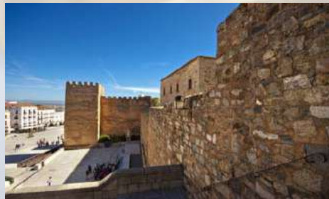
Murallas de Cáceres (Cáceres)