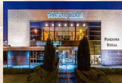
Tanatorio Retuerto - Baracaldo (Vizcaya)