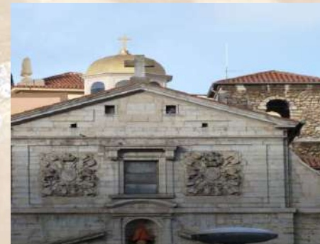
Iglesia de Ntra. Sra. de la Anunciación (Santander)