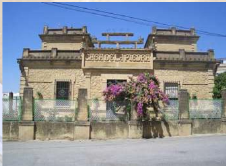
Casa de la Piedra - Porcuna (Jaén)