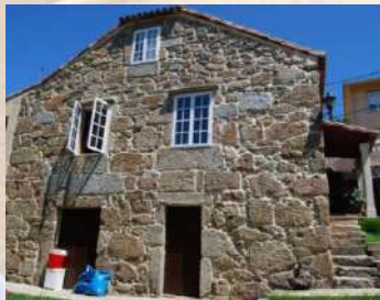
Viviendas de granito (Pontevedra)