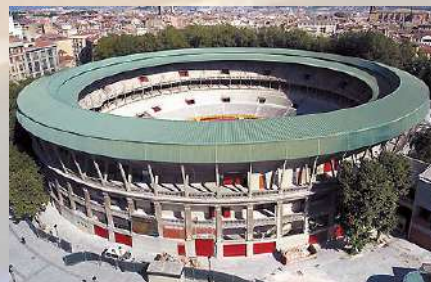
Plaza de Toros (Pamplona)