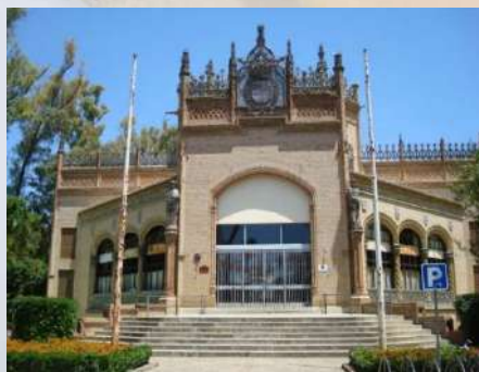
Pabellón Real – Parque Mª Luisa (Sevilla)