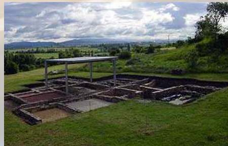
Yacimiento Arqueológico Iruña- Veleia (Álava)