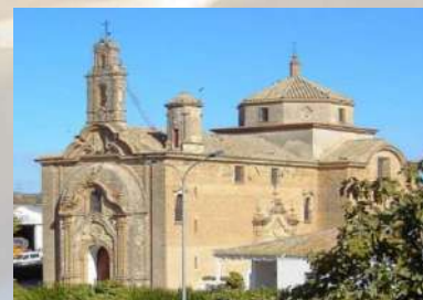
Iglesia de Ntro. Padre Jesús – Lora del Río (Sevilla)