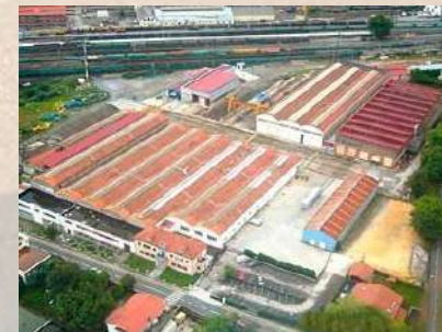
Edificio CAF - Beasain (Guipúzcoa)