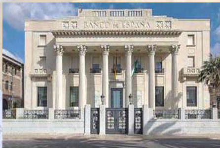
Edificio Banco de España (Málaga)