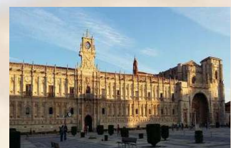
Parador San Marcos (León)