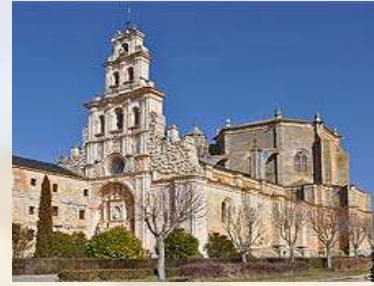
Monasterio de Sta. Mª de la Vid (Burgos)