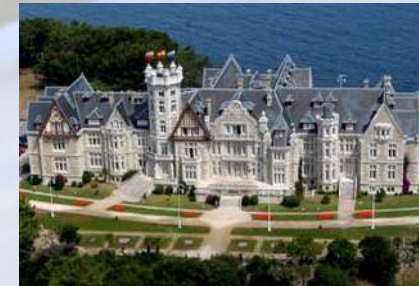
Palacio de la Magdalena (Santander)