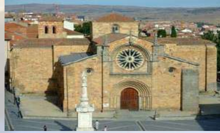
Iglesia de San Pedro (Ávila)