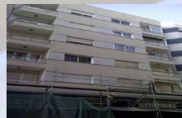
Complejo residencial – Vigo (Pontevedra)