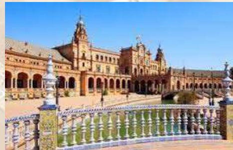
Plaza de España (Sevilla)