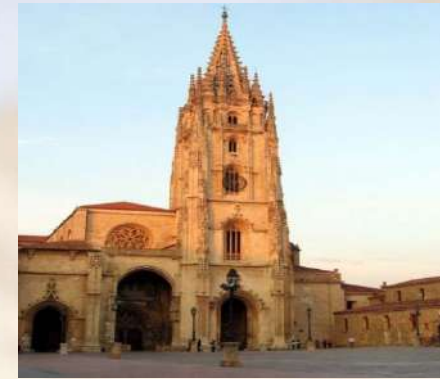
Catedral Oviedo (Asturias)