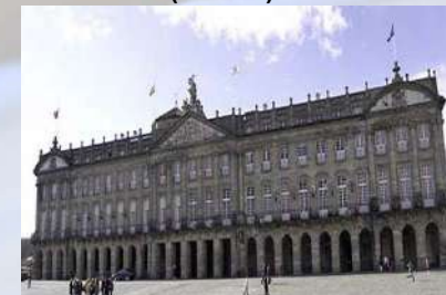
Palacio Raxoi-Ayuntamiento (Santiago de Compostela)