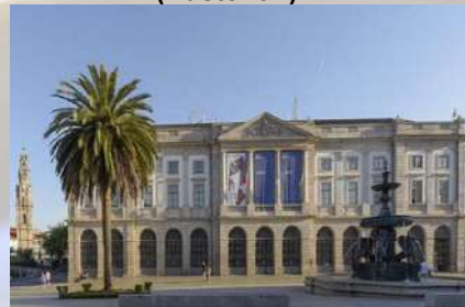
Rectoría Universidad de Oporto (Portugal)