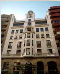
Hotel Vincci Zentro (Zaragoza)