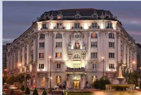
Hotel Carlton (Bilbao)