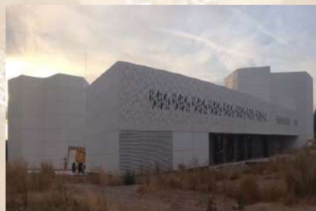
Centro de Creación Contemporáneo (Córdoba)