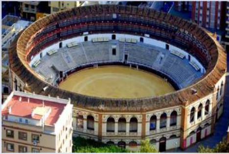
Plaza de toros La Malagueta (Málaga)