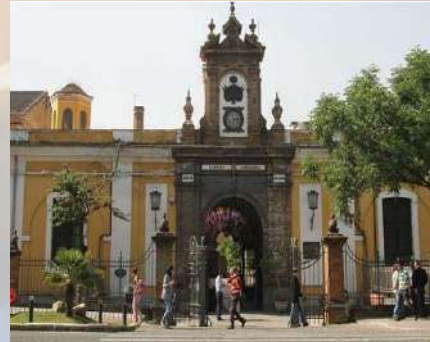
Real Fábrica de Artillería (Sevilla)