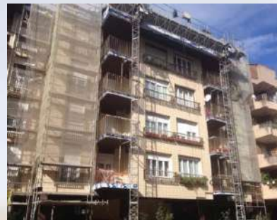
Complejo residencial – Zumaia (Guipúzcoa)