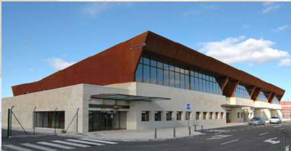
Aeropuerto de Mataban (Salamanca)