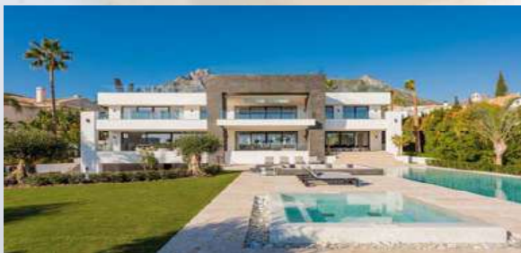
Viviendas de lujo – Marbella (Málaga)