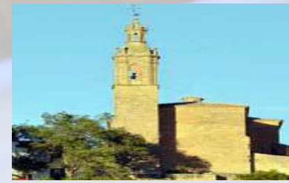
Iglesia de San Zoilo - Sansol (Navarra)