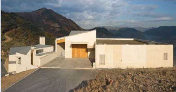
Bodegas Descendientes de J. Palacios (León)