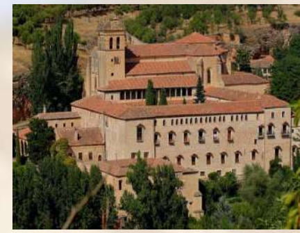
Monasterio del Parral (Segovia)