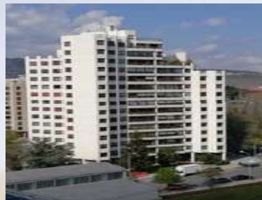
Complejo Residencial - Torre Erroz (Pamplona)