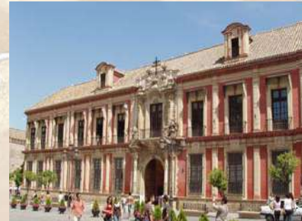
Palacio Arzobispal (Sevilla)