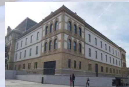
Edificio Tabacalera (San Sebastián)