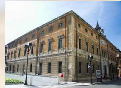
Centro Cultura Jovellanos (Gijón)