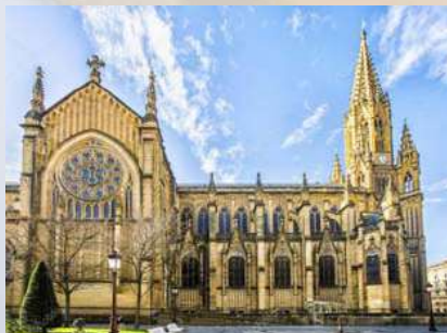
Catedral del Buen Pastor (San Sebastián)