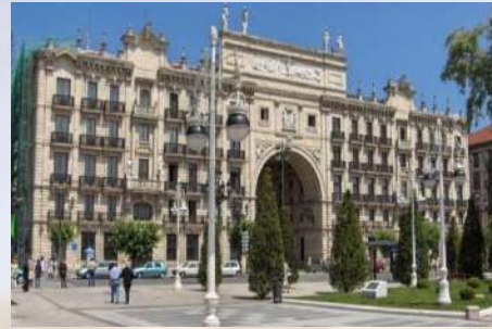
Sede Central Banco Santander (Santander)