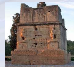
Yacimiento Arqueológico Tarraco (Tarragona)