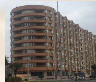
Complejo residencial (Cádiz)