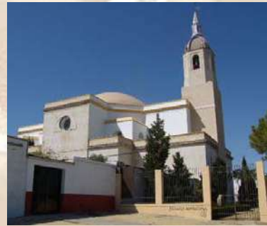
Nª Sñra. de las Virtudes Puebla de Cazalla (Sevilla)