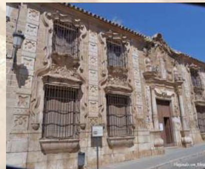
Cilla del Cabildo - Osuna (Sevilla)