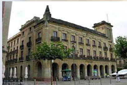
Edificio Banco Santander (Pamplona)