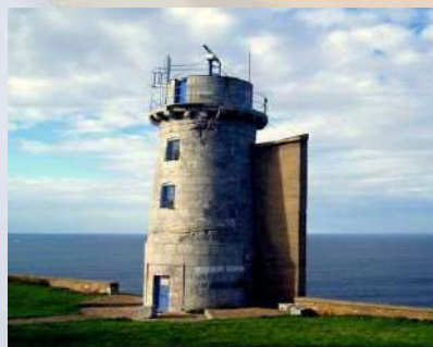
Faro del Cabo Matxitxako (Vizcaya)