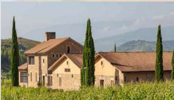
Bodegas Murua - Elciego (Álava)