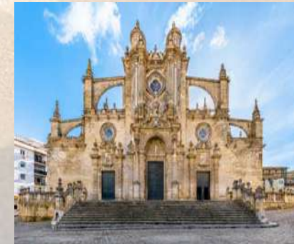
Catedral de Jerez de la Frontera (Cádiz)