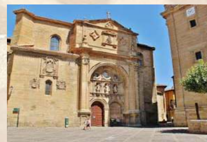
Catedral Santo Domingo de la Calzada (La Rioja)