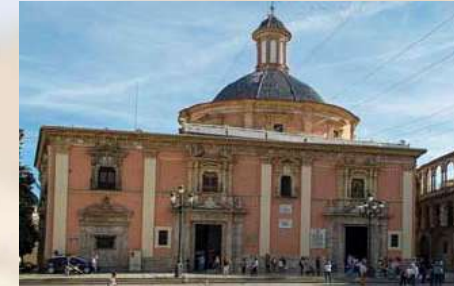
Basílica de la Virgen de los Desamparados (Valencia)