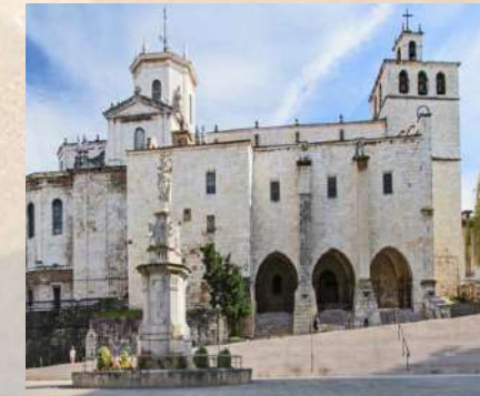
Catedral de Santander (Cantabria)