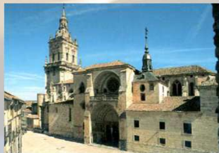
Catedral de Burgo de Osma (Soria)