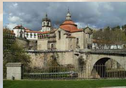
Iglesia San Gonzalo (Amarante - Portugal)