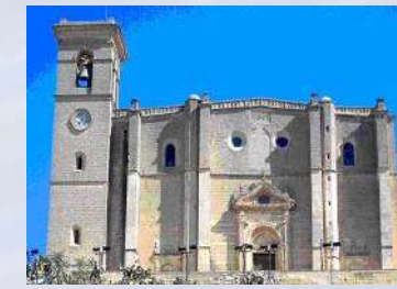
Colegiata de Osuna (Sevilla)