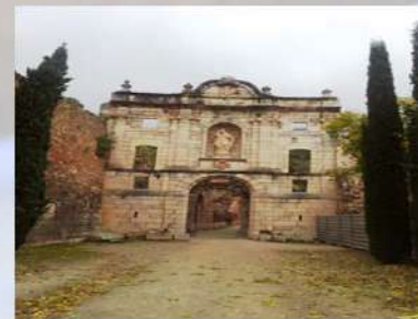
Yacimiento Arqueológico Scala Dei (Tarragona)