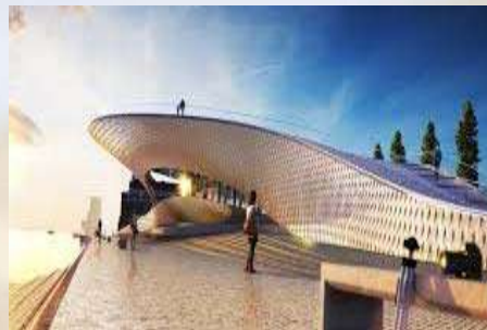
Edificio MAAT (Lisboa)