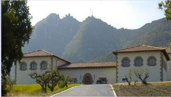
Bodegas Quaderna Vía - Iguzquiza (Navarra)