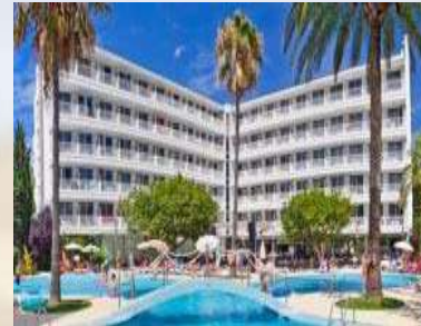
Hotel JS Sol de Alcudia (Mallorca)