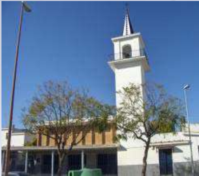
Parroquia Señora de La Candelaria (Sevilla)