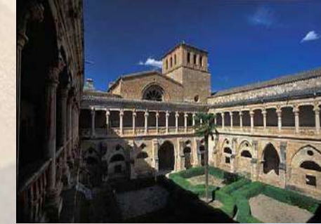
Monasterio de Santa María de Huerta (Soria)