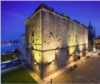
Parador de Fuenterrabia (Guipúzcoa)