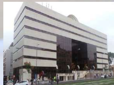
Juzgados de La Caleta (Granada)