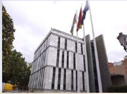
Edificio de alabastro Gobierno La Rioja (Logroño)