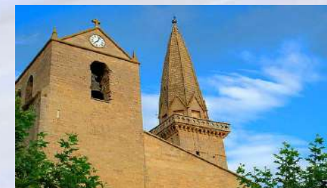
Iglesia de San Pedro– Olite (Navarra)