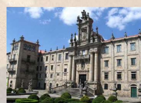
Iglesia de San Martín Pinario (Santiago Compostela)