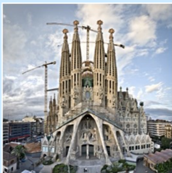
Sagrada Família (Barcelona)