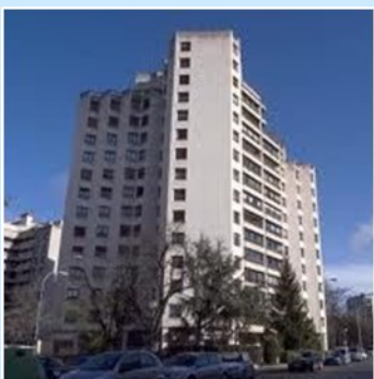
Complejo Residencial - Torre Erroz (Pamplona)