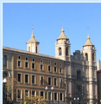
Colegio Escolapios (Zaragoza)