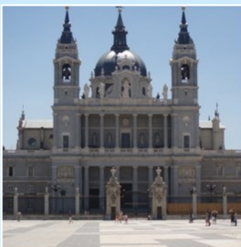
Catedral de la Almudena (Madrid)