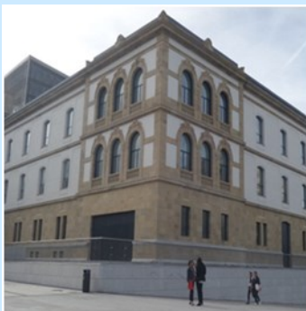
Edificio Tabacalera (San Sebastián)