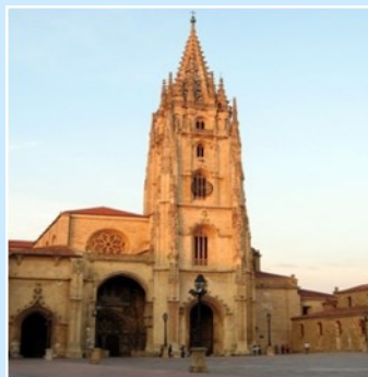
Catedral Oviedo (Asturias)